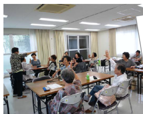
栄生会場: みんなでジャンケン

「いきいきくらぶ」は名古屋市の地域支援事業で、健康体操・手作り・ゲームなどを楽しみながら「介護予防」についての理解を深めるとともに、仲間作りをすすめ、地域においていきいきとした生活が過ごすことができるよう支援しています。