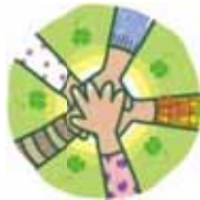
も〜やっこ障害福祉マーク

西区のみなさんに、障害ふくしのことや障害のある方が作った製品をもっと知ってもらいたい...という思いから、新しくマークを作りました。このマークの紹介と、デザインした方の表彰を行います。