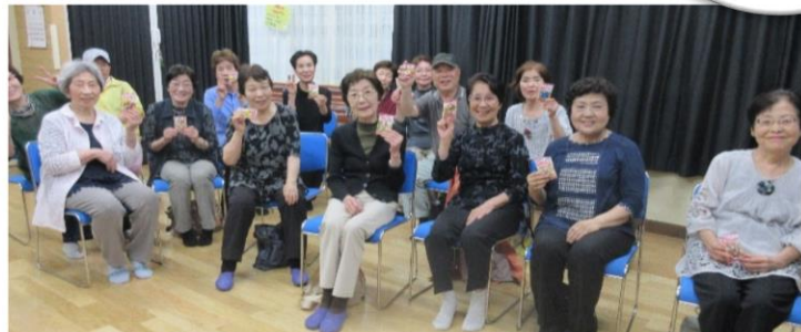
勝利チームの笑顔 😊