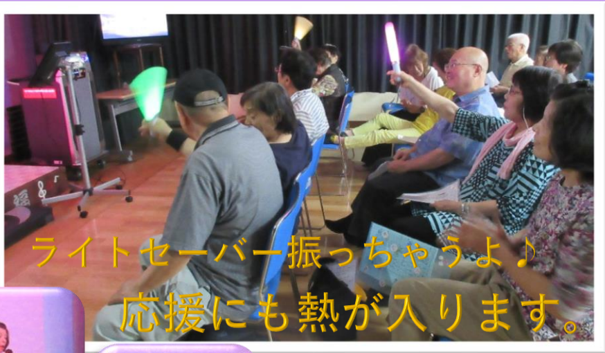
ライトセーバー振っちゃうよ♪ 応援にも熱が入ります。