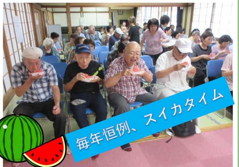
毎年恒例、スイカタイム