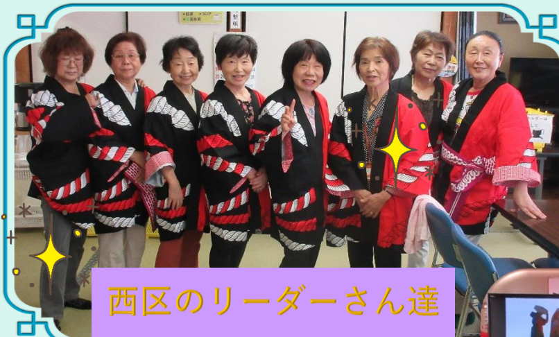
西区のリーダーさん達