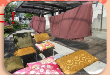
ファブリック類のお洗濯