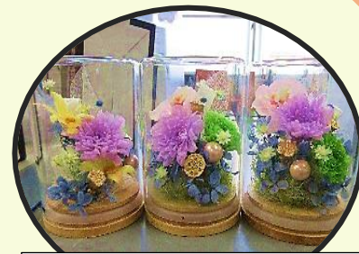
作品例（内容は変わります）